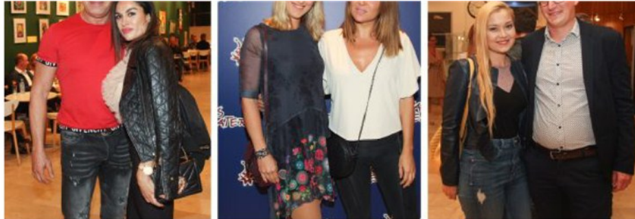
Premiero so si ogledali številni znani Slovenci.